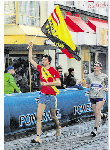
Laufen für „Raus aus Euratom“.

„Österreich hat nichts im Euratom-Vertrag verloren, wir müssen aber 40 Millionen Euro jährlich dafür einzahlen“, so Neff. Es sei Unrecht, die Atomkraft in der EU einseitig zu fördern, ebenso wie das Hinaufsetzen von Grenzwerten. „Die Atomindustrie ist tödlich und produziert auf Kosten der Menschen“, empört sich